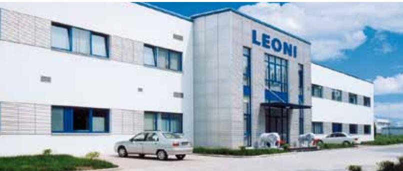
Technisch meistens einen Schritt voraus: LEONI-Electrical-Appliance-Assemblies-Standorte (von links) in China (Changzhou) und der Slowakei.